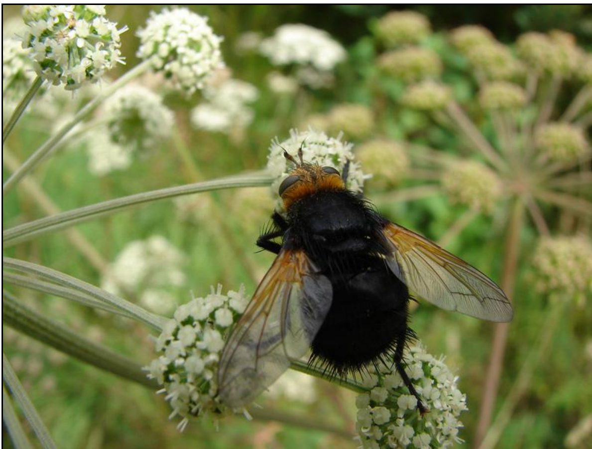
Fot. 1. Rączycza wielka - Tachina grossa.